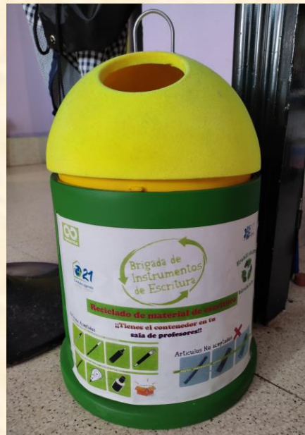
GELA BAKOITZEAN ESKOLAKO MATERIALA BILTZEKO KUTXAK JARRI